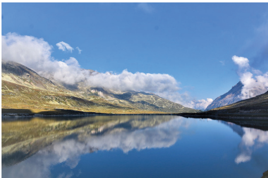
Lago Bianco Bernina